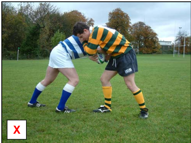
Le maul n'est pas formé